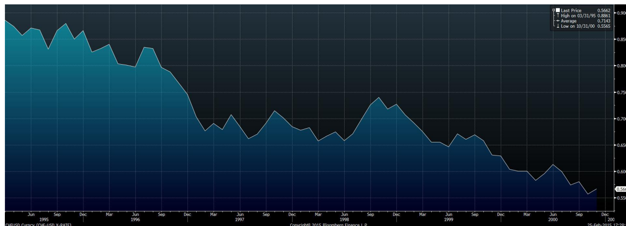
Grafika 3: Wykres CHF/USD w latach 1995-2000

Dość znaczny odpływ rodzimego kapitału połączony z łagodną polityką monetarną, spowodował nie tylko deprecjację REER franka o 20%, ale np. nominalne obniżenie wartości szwajcarskiej waluty w relacji do amerykańskiego dolara o prawie 40%.